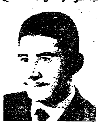
الشهيد يحيى السمودي